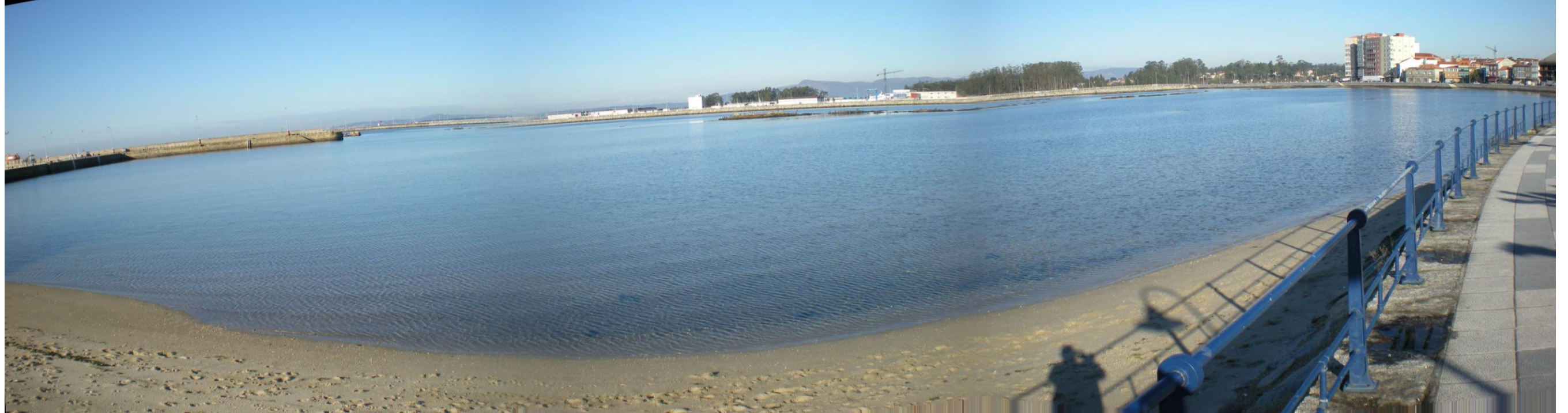
FOTO 37: PANORÁMICA MARÍTIMA COMPRENDIDA ENTRE PUERTOS DE SANTO TOMÉ Y DE TRAGOVE