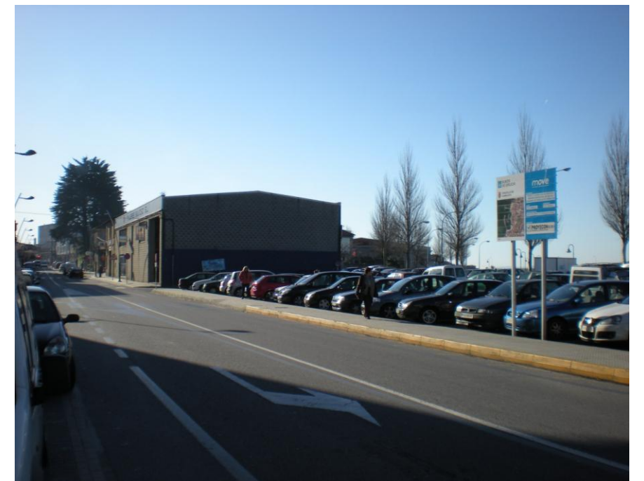
FOTOS 26, 27 Y 28: ZONA DE USOS NÁUTICO-DEPORTIVOS CON EDIFICACIONES VARIAS (PLAZA DE ABASTOS, RPOTECCIÓN CIVIL, ETC.)