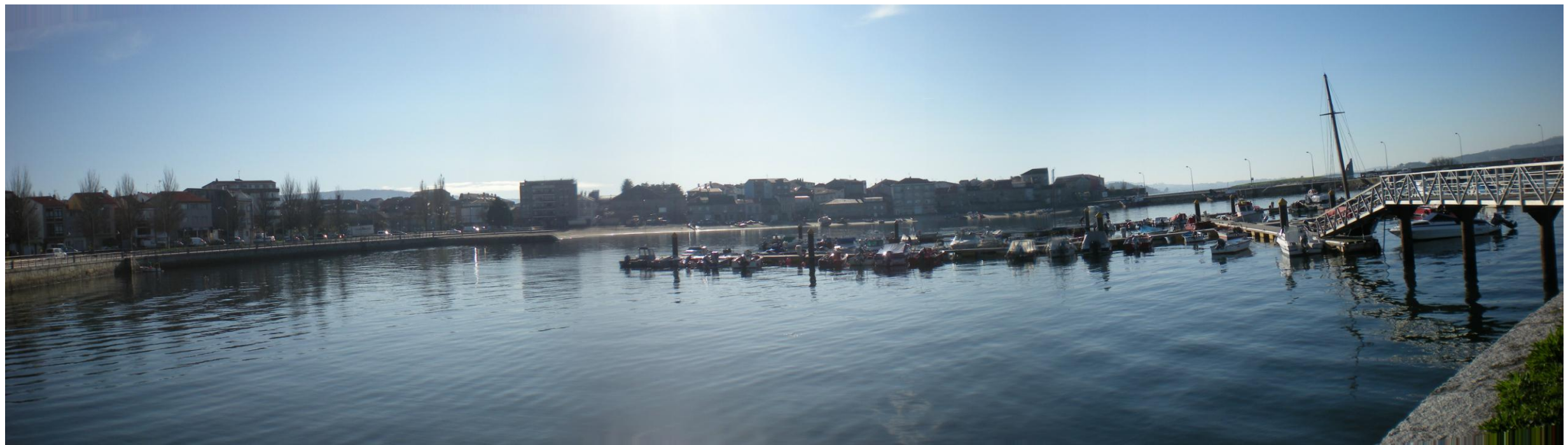
FOTO 31: PANORÁMICA DE PANTALÁN DE DE EMBARCACIONES NÁUTICO-DEPORTIVAS DENTRO DE DÁRSENA DE SANTO TOMÉ