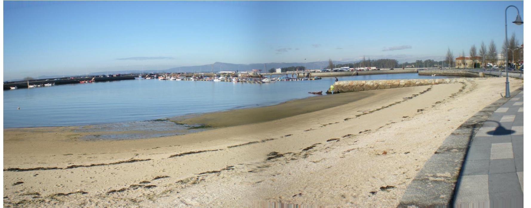
FOTO 33: PLAYA SUR ANEXA A PASEO MARÍTIMO EN INMEDIACIONES DE INSTALACIONES DE CLUB DE PIRAGÜISMO