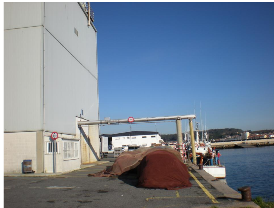
FOTO 19: FÁBRICA DE HIELO EN CANTIL DE DÁRSENA DEL PUERTO DE TRAGOVE