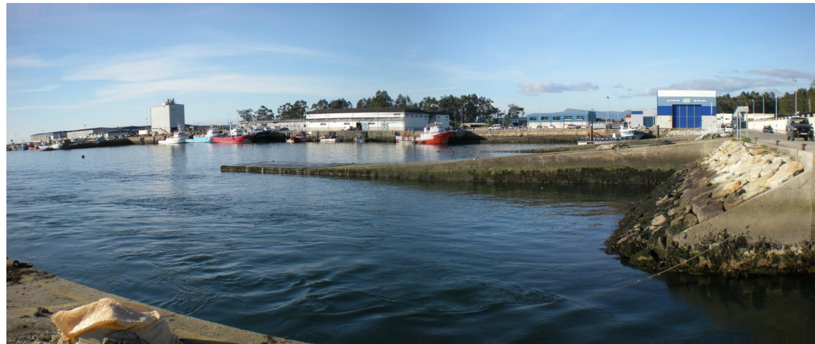
FOTO 8: RAMPA EN DÁRSENA DE PUERTO DE TRAGOVE CON EDIFICIOS DE USOS PESQUEROS AL FONDO