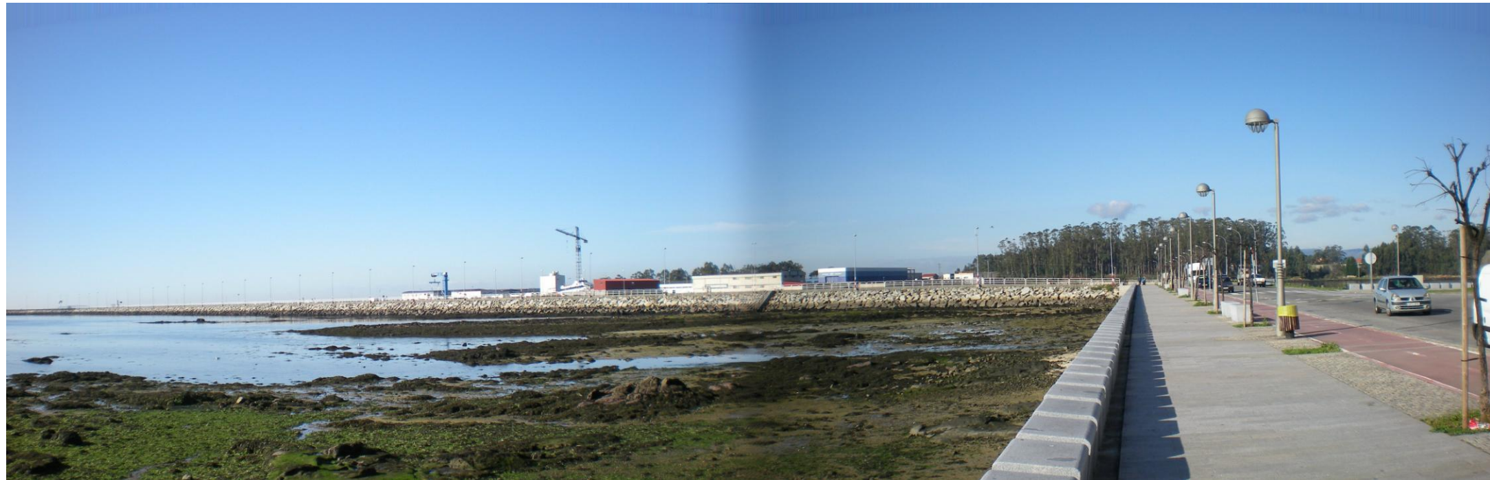
FOTO 1: VIAL DE CONEXIÓN ENTRE PUERTOS, CON VISTA GENERAL DEL PUERTO DE TRAGOVE AL FONDO