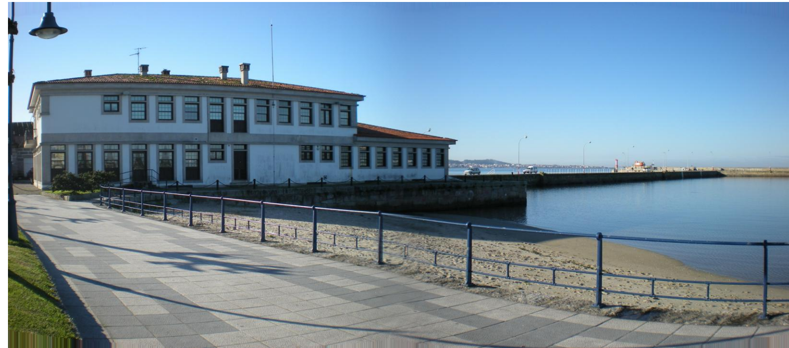
FOTO 22: PANORÁMICA DIQUE DE ABRIGO NORTE DEL PUERTO DE SANTO TOMÉ CON EDIFICIO SOCIAL DE LA MARINA EN PRIMER TÉRMINO