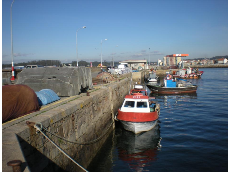
FOTO 35: DIQUE DE ABRIGO OESTE EN ZONA DE USOS DE INFRAESTRUCTURA BÁSICA DEL PUERTO DE SANTO TOMÉ