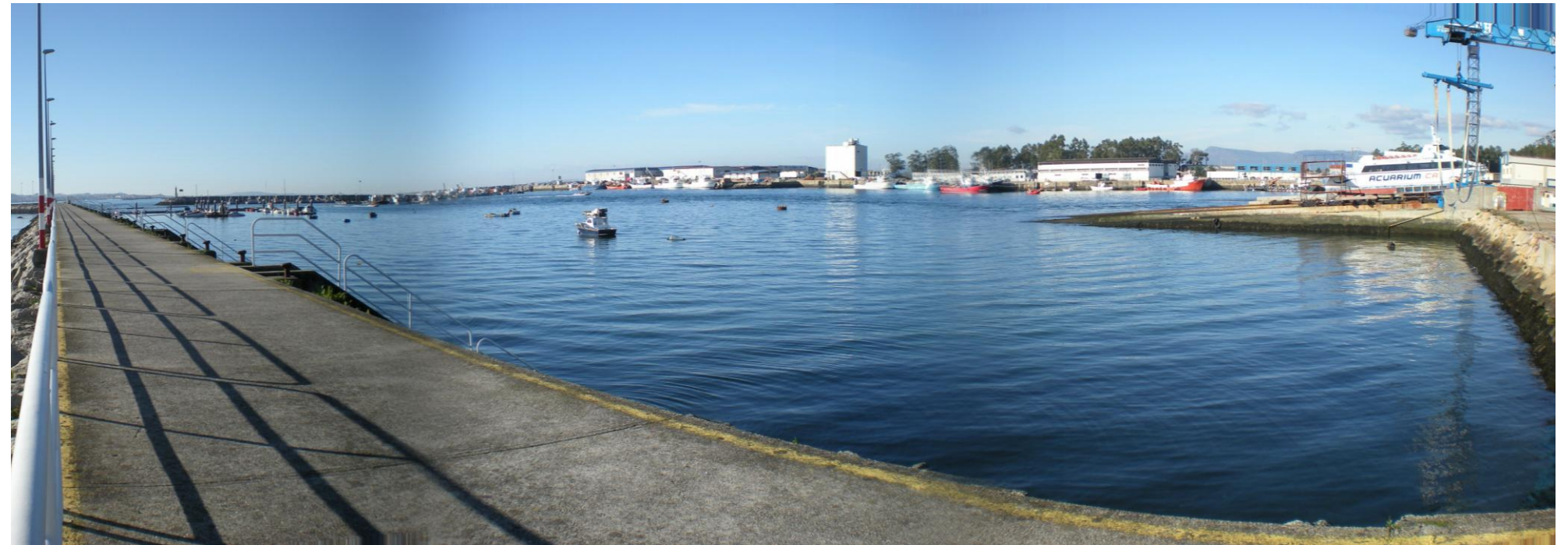
FOTOS 5 Y 6: DIQUE SUR DEL PUERTO DE TRAGOVE CON RAMPA VARADERO Y ESCALERAS ASOCIADAS