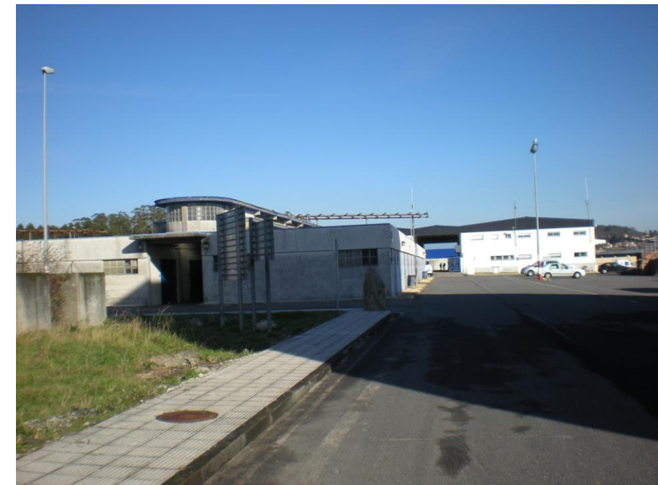
FOTOS 15 Y 16: EDIFICIOS E INSTALACIONES DE USOS PESQUEROS Y COMPLEMENTARIOS