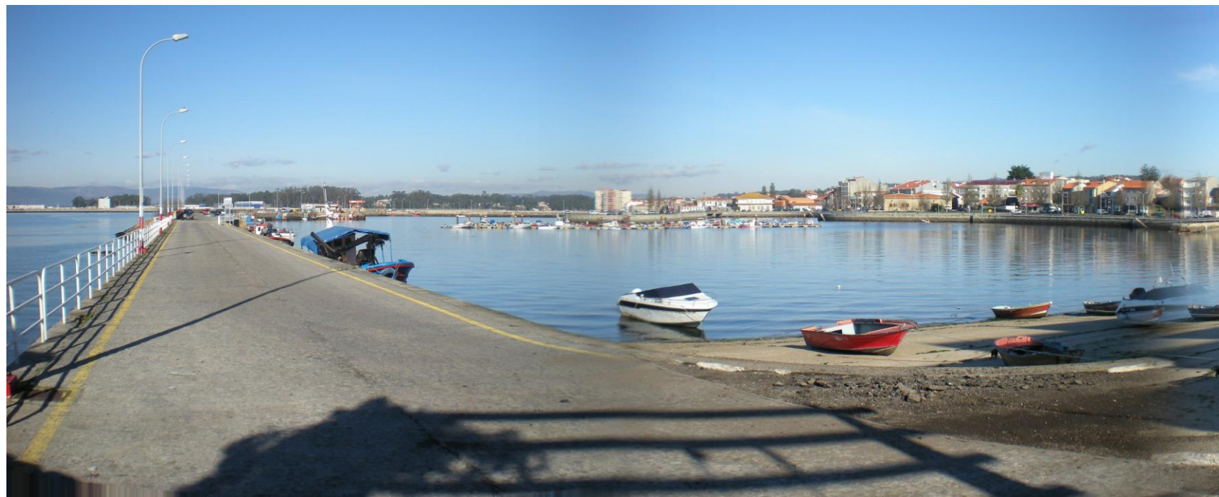
FOTO 34: PANORÁMICA DE PUERTO DE SANTO TOMÉ, CON DIQUE DE ABRIGO OESTE A LA IZQUIERDA