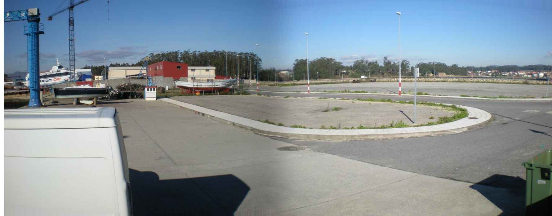
FOTO 7: EXPLANADA EN PROXIMIDAD DE DIQUE SUR EN TORNO A USOS COMPLEMENTARIOS E INFRAESTRUCTURA BÁSICA DEL PUERTO