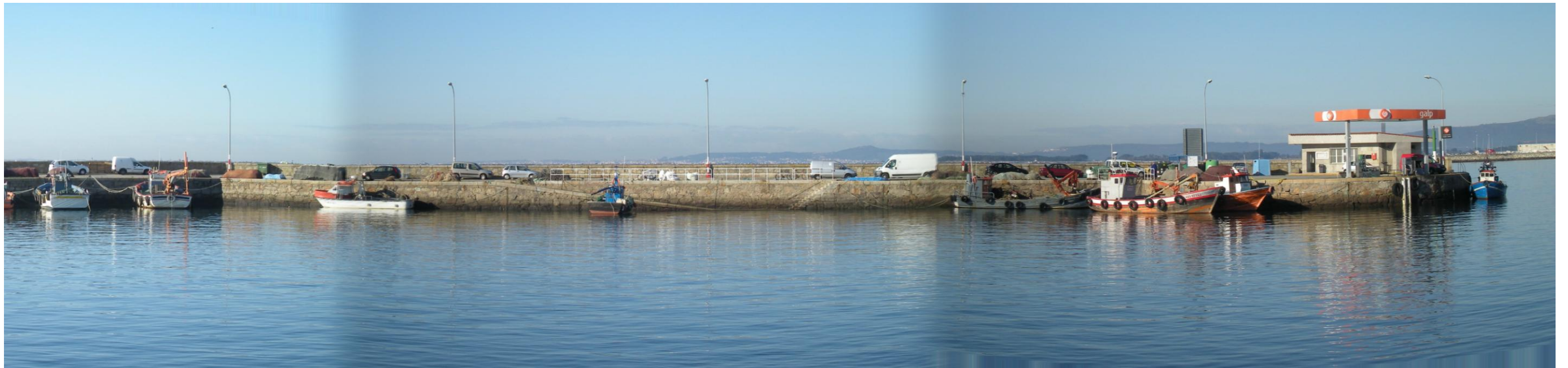
FOTO 36: PANORÁMICA DIQUE OESTE DEL PUERTO DE SANTO TOMÉ, CON ESCALERAS Y RAMPAS ASOCIADAS Y GASOLINERA EN EXTREMO FINAL