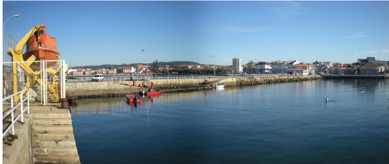
FOTO 25: DIQUE DE ABRIGO NORTE DEL PUERTO DE SANTO TOMÉ -PARTE INTERIOR- CON RAMPAS Y ESCALERAS ASOCIADAS