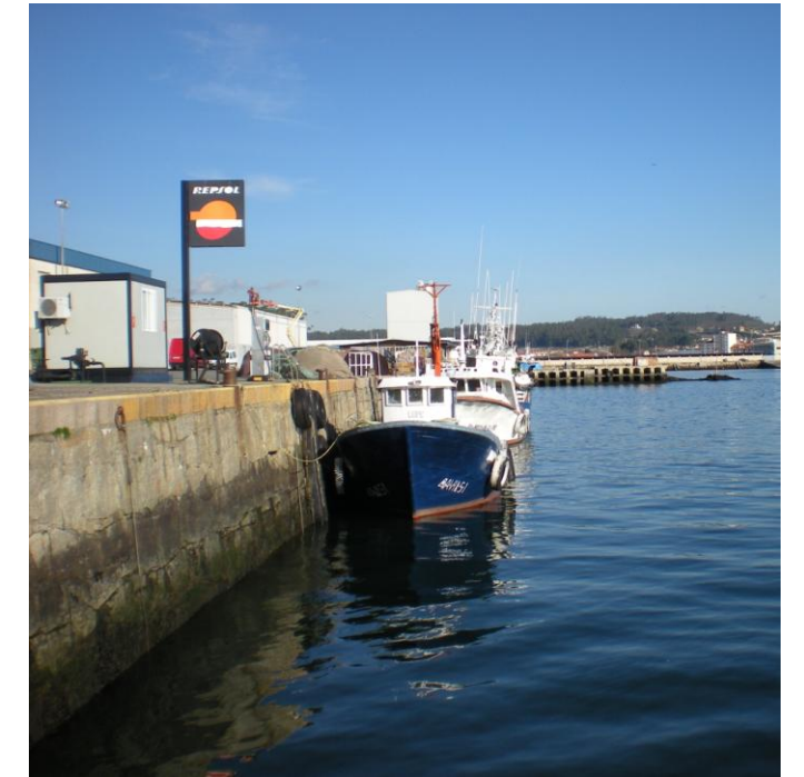
FOTOS 17 Y 18: PANTALÁN PARA EMBARCACIONES PESQUERAS JUNTO A DIQUE DE ABRIGO OESTE DEL PUERTO DE TRAGOVE, CON GASOLINERA EN INMEDIACIONES