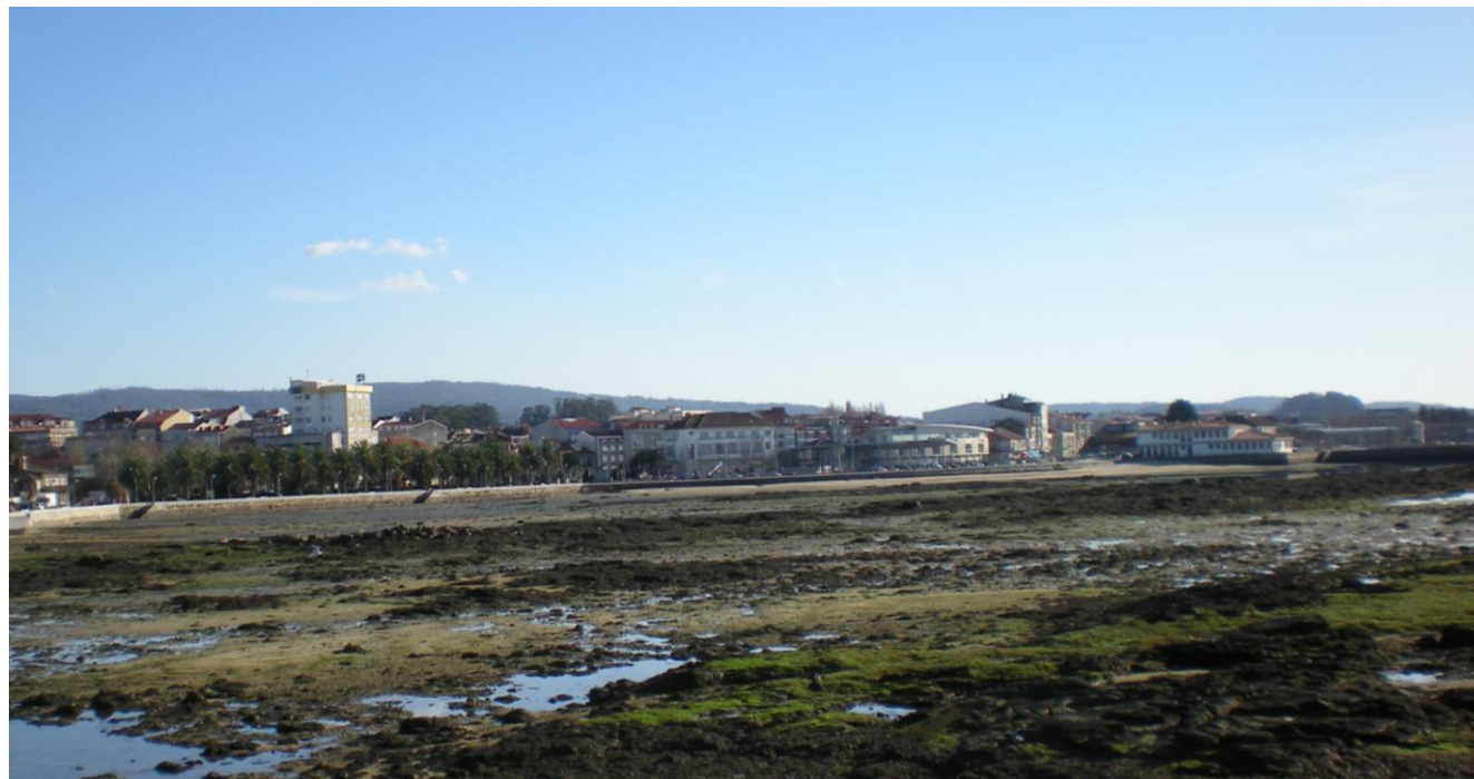
FOTO 2: VISTA PASEO MARÍTIMO DE CAMBADOS PREVIO A PUERTO DE TRAGOVE