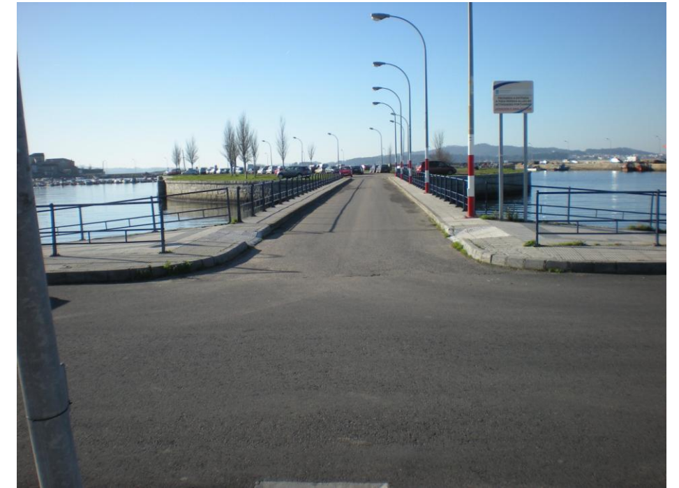
FOTOS 29 Y 30: PUENTE DE ACCESO A ISLA ARTIFICIAL INTERIOR CON ZONA DE APARCAMIENTO HABILITADA EN DÁRSENA DEL PUERTO DE SANTO TOMÉ