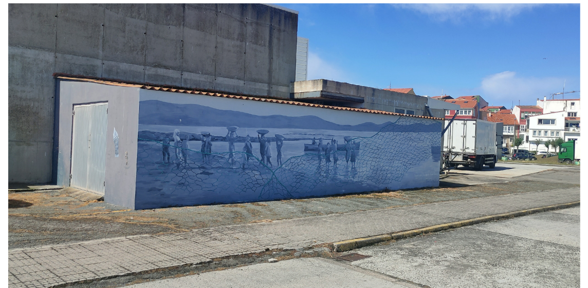
ALZADOS PRINCIPAL E LATERAL DEREITO