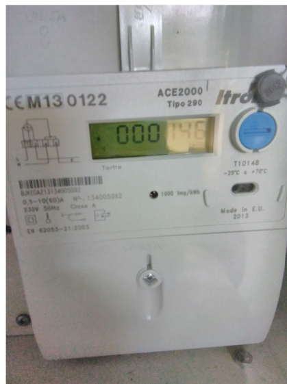
CONTADOR ENERXÍA Nº 134005092