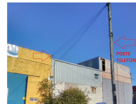
CONEXIÓN AÉREA COMUNICACION