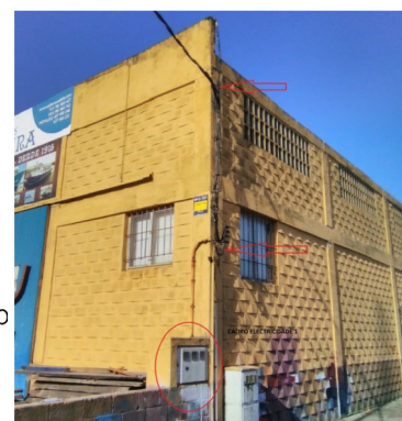
CONTADOR NAVE 1 ENERXÍA