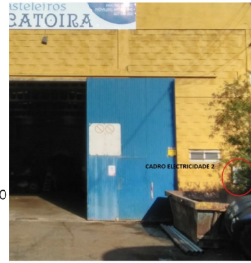
CONTADOR NAVE 3 ENERXÍA