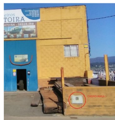
CONTADOR NAVE 1 ABASTECIMENTO