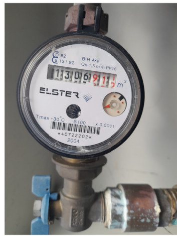
CONTADOR ABASTECIMENTO Nº 40722202