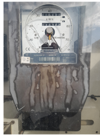
CONTADOR ENERXÍA Nº 98527403