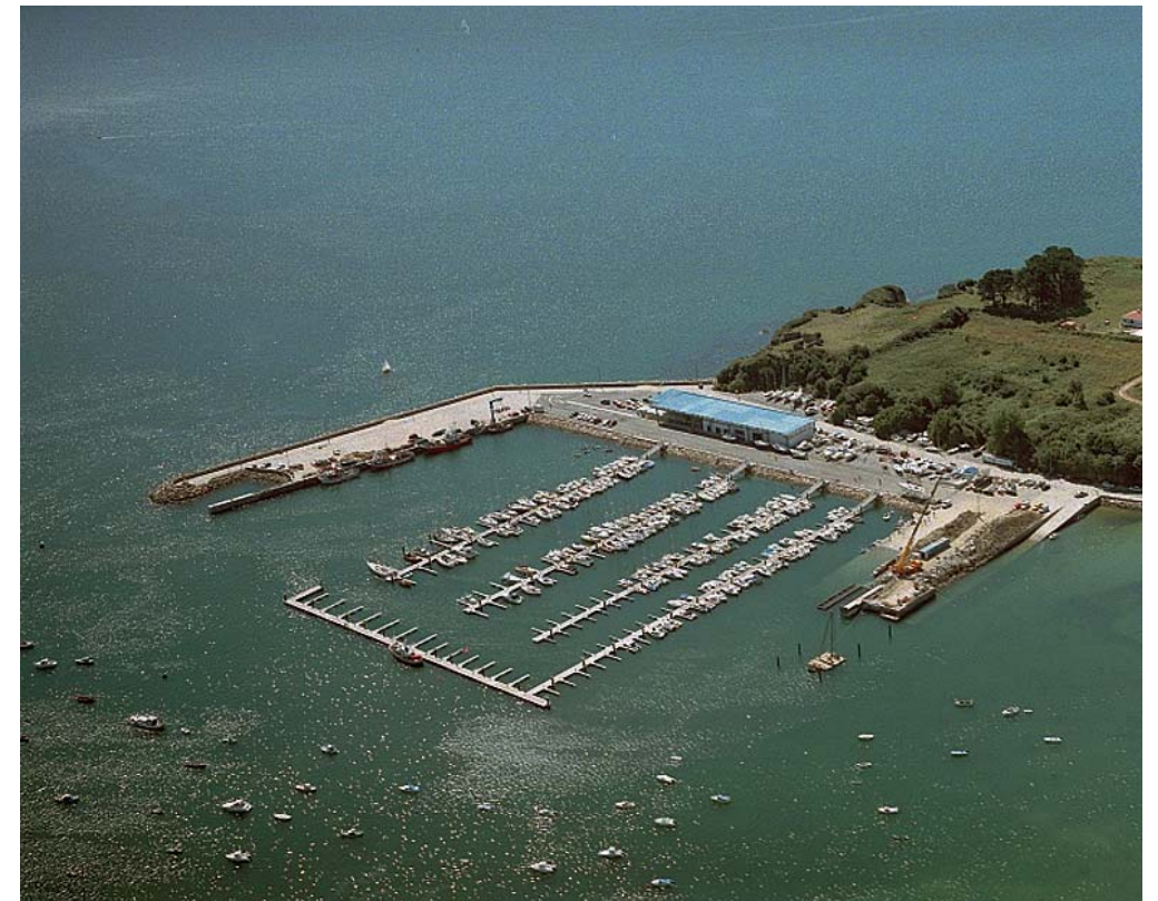
FOTO 34: VISTA AÉREA DEL PUERTO DE ARES. EN PRIMER PLANO SE ENCUENTRAN LOS ÚLTIMOS PANTALANES CONSTRUIDOS