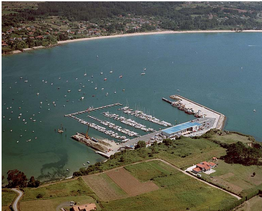
FOTO 33: VISTA AÉREA DEL PUERTO DE ARES. AL FONDO SE OBSERVAN LAS PLAYAS DE SESELLE Y RASO