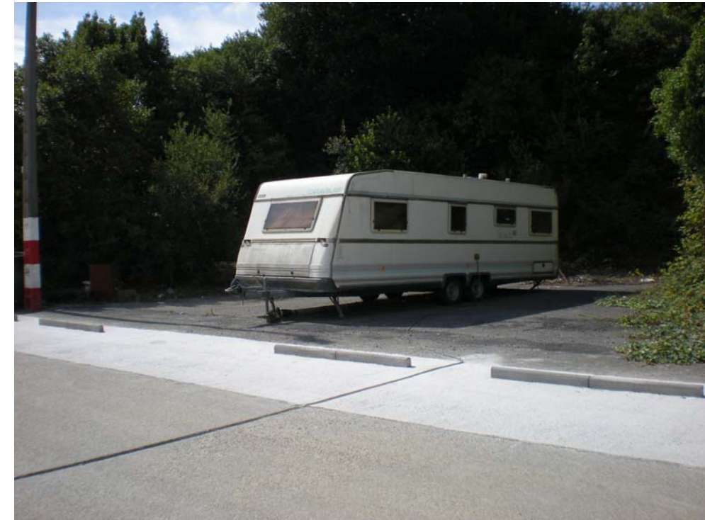
FOTOS 26 Y 27. ZONA RESERVADA PARA USOS COMPLEMENTARIOS