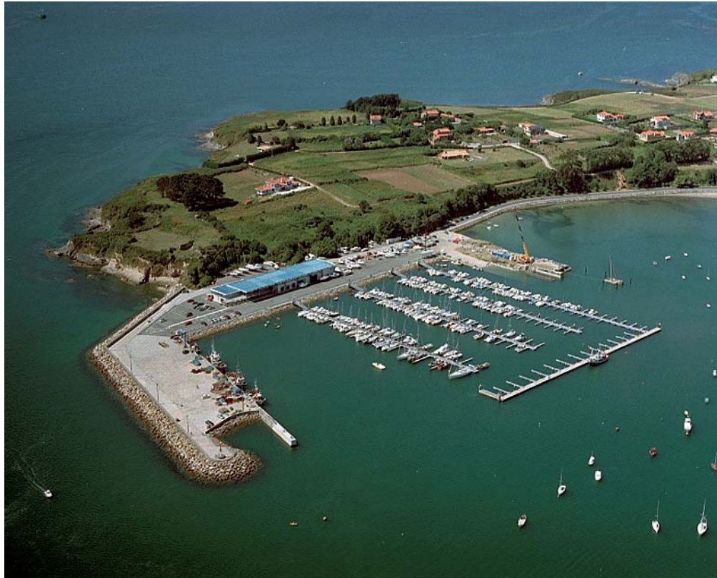
FOTO 31: VISTA AÉREA DEL PUERTO DE ARES. TRAS EL PUERTO SE OBSERVAN LOS CANTIS DAS MIRANDAS