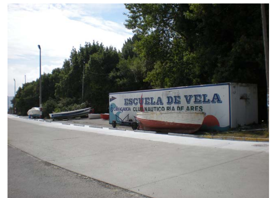
FOTOS 28, 29 Y 30. ZONAS RESERVADAS PARA USOS DEPORTIVOS