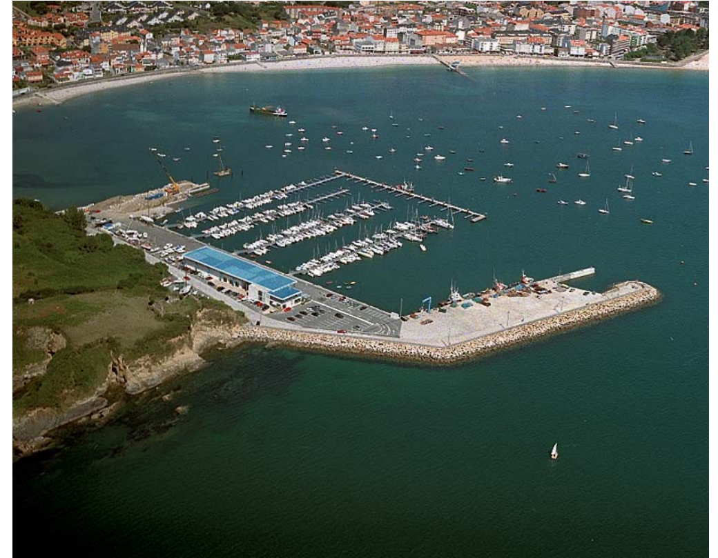
FOTO 32: VISTA AÉREA DEL PUERTO DE ARES. AL FONDO SE OBSERVA EL NÚCLEO DE ARES