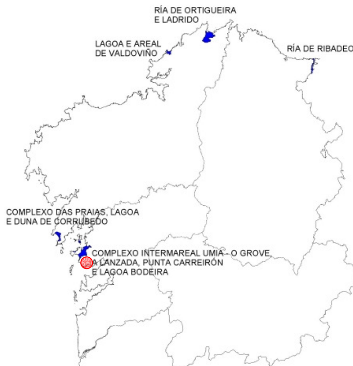
Ilustración 3. Humedales Convenio Ramsar.