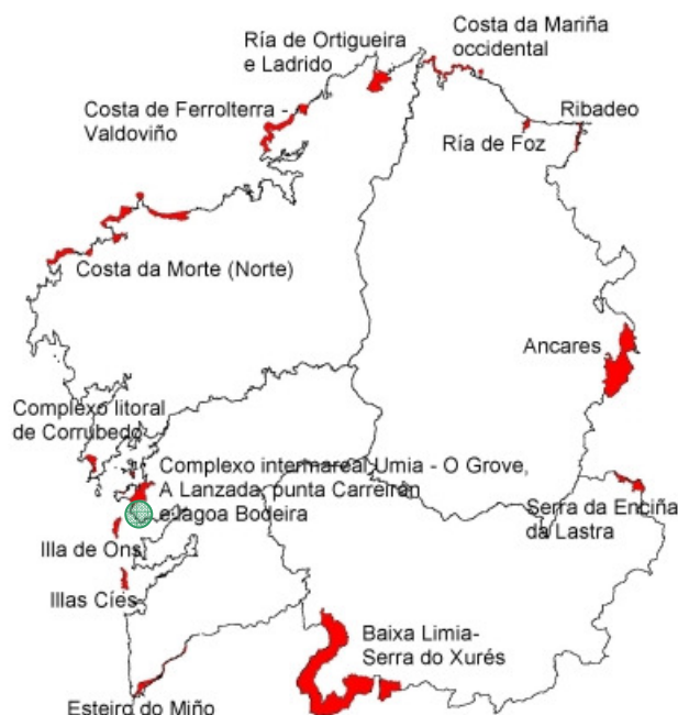
Ilustración 1. Zonas de Especial Protección para las Aves