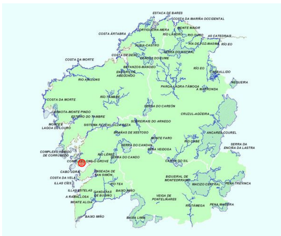
Ilustración 2. Lugares de Interés Comunitario.