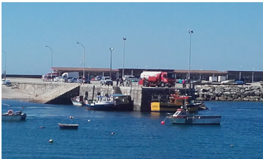
Muelle utilizado para suministro de combustible desde camión cisterna