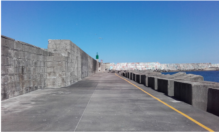
Morro del dique