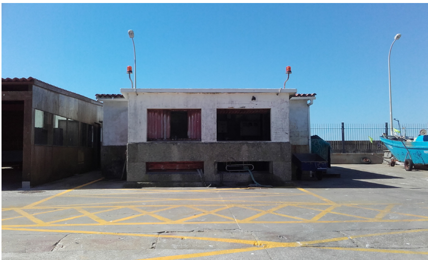
Galpón de uso pesquero