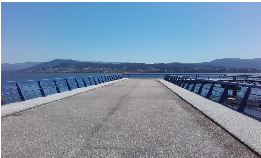
Muelle de pasajeros