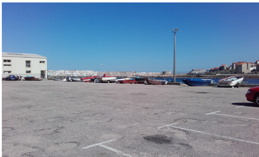
Explanada del puerto