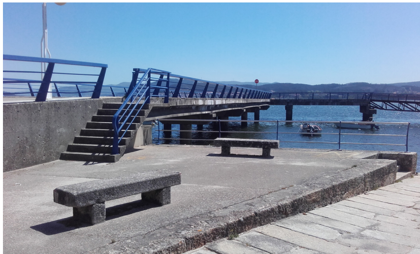
Muelle de pasajeros