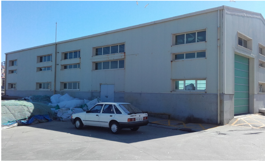
Nave de redes