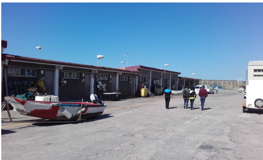
Edificio de departamentos