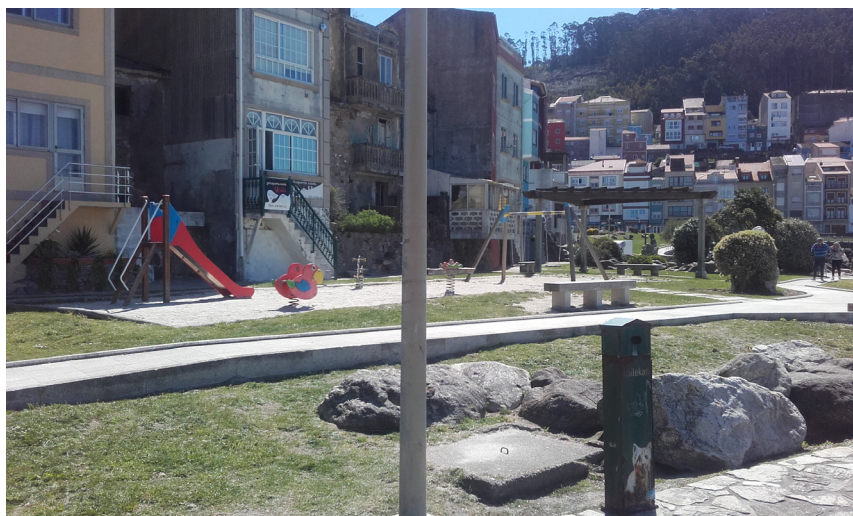
Área recreativa infantil