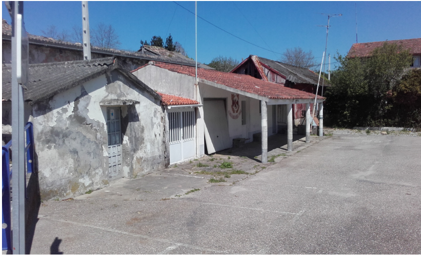
Edificaciones Protección Civil y Cruz Roja