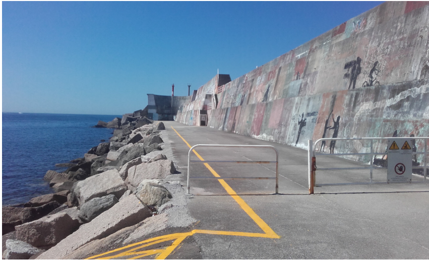
Dique de abrigo