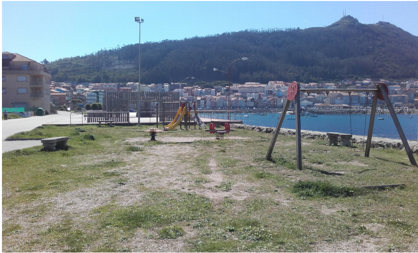
Área recreativa infantil