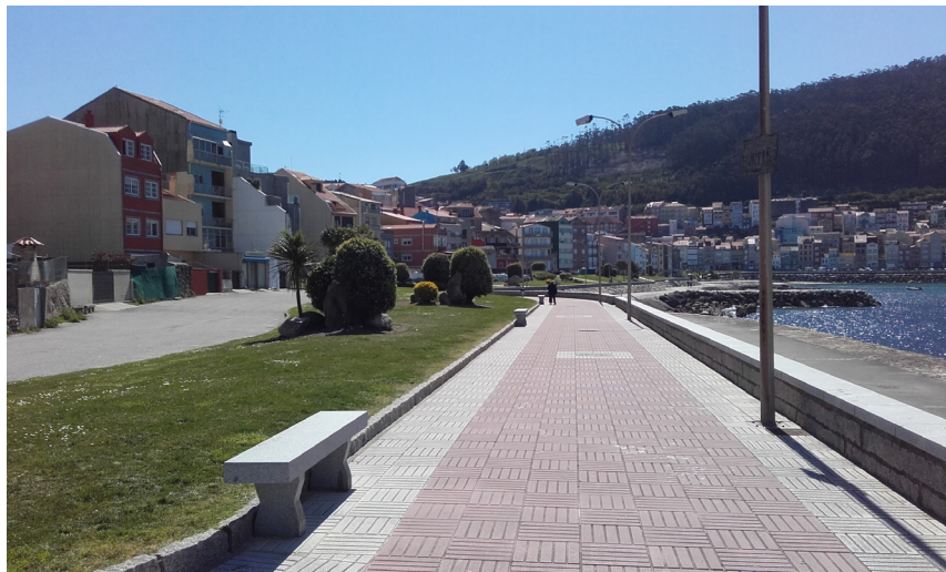
Paseo marítimo: vial superior