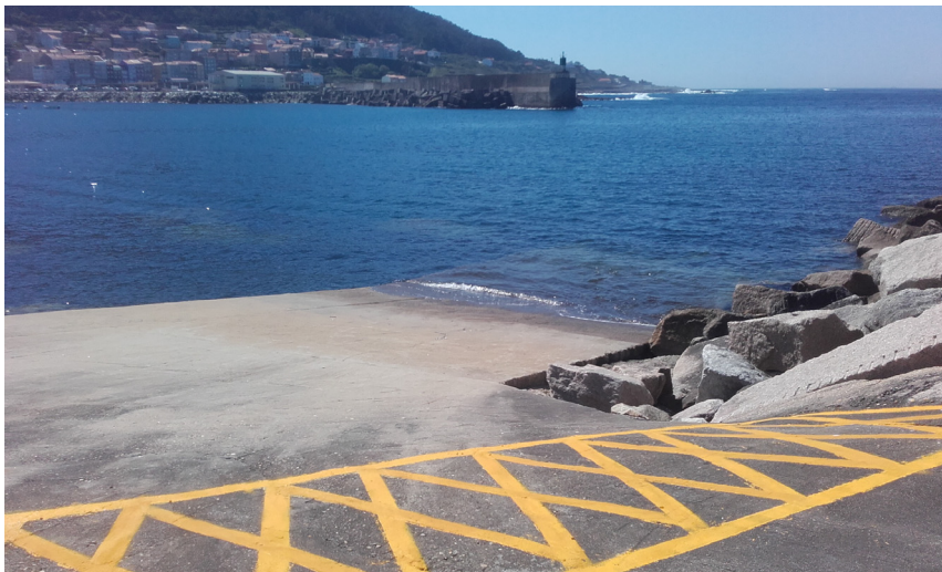
Rampa anexa al dique