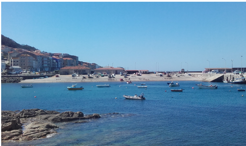
Rampa de varada