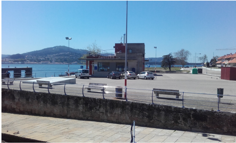
Estación marítima y explanada