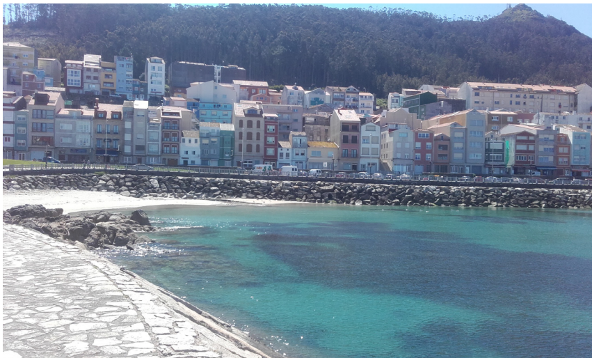
Playa y frente marítimo