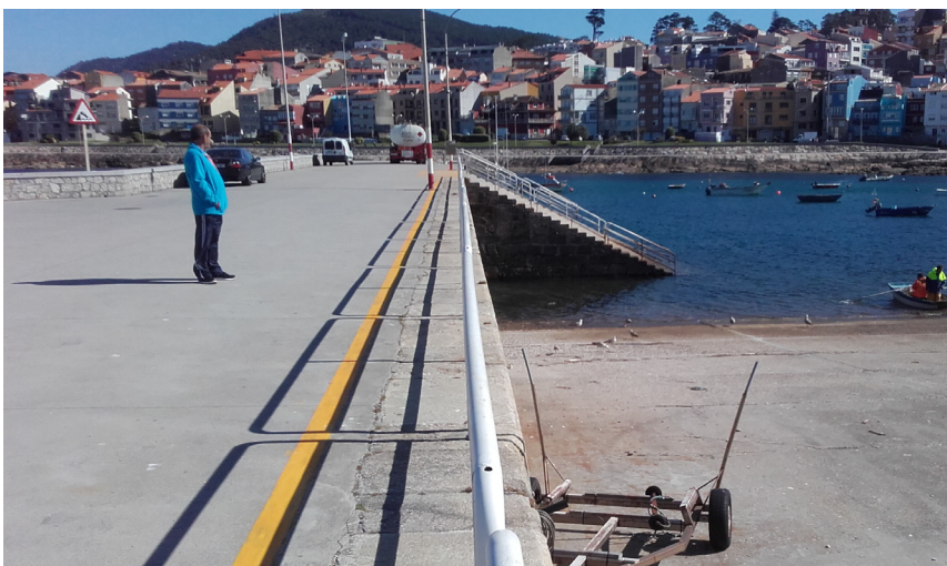
Muelle utilizado para suministro de combustible desde camión cisterna