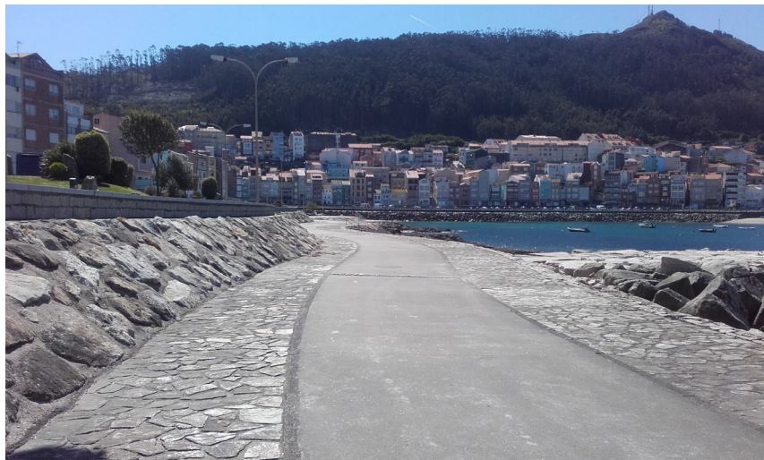
Paseo marítimo: vial inferior