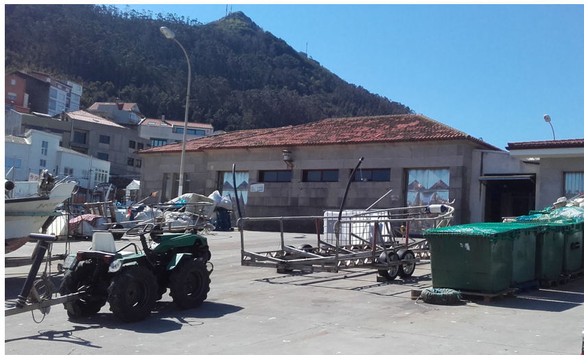
Lonja de A Guarda