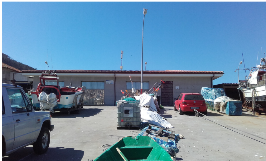
Instalación para servicios múltiples