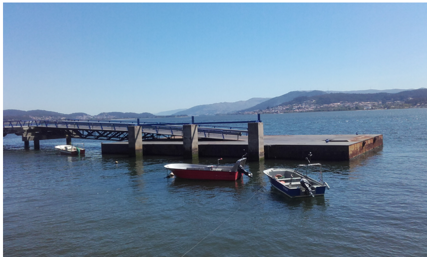
Muelle de pasajeros