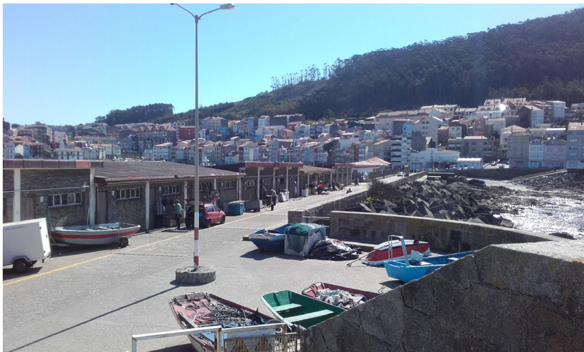
Edificio de departamentos y vial principal del puerto