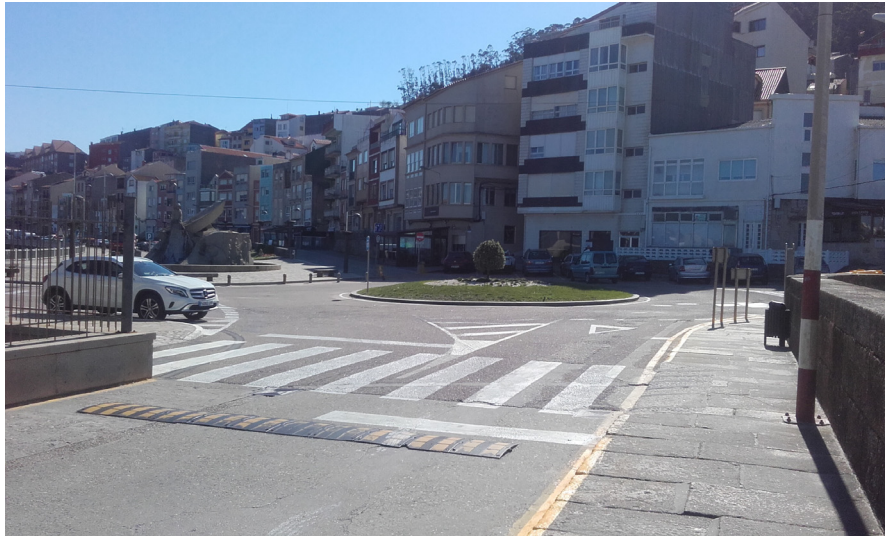
Vial de entrada al puerto