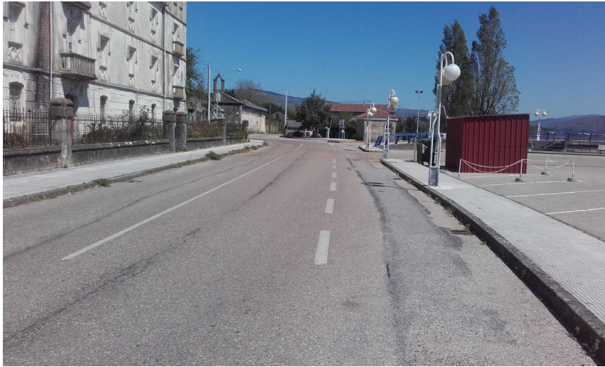
Vial principal de acceso y quiosco