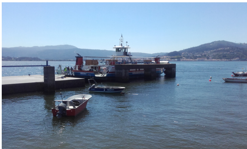
Duque de Alba