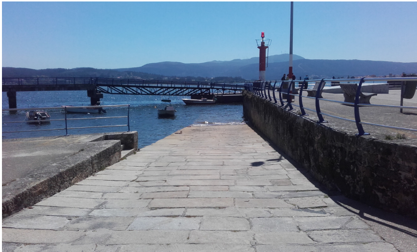
Rampa anexa a la explanada