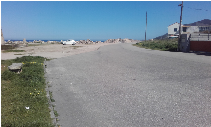
Vial principal en acceso norte