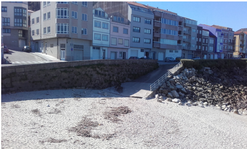
Playa de O Carreiro y rampa de acceso