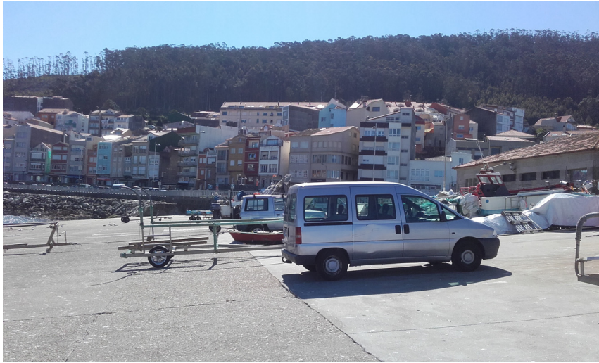
Rampa de varada