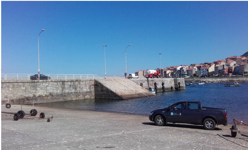
Rampa de varada y escaleras