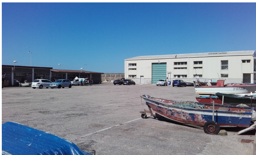
Explanada del puerto. Al fondo: nave de redes