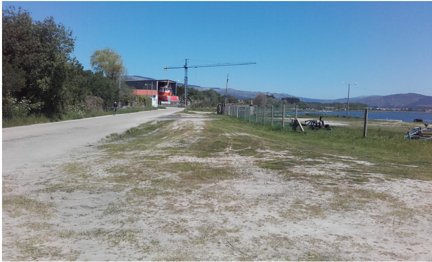
Explanada norte y vial principal