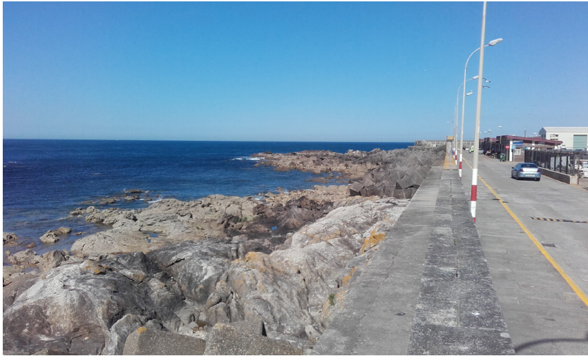
Lateral exterior del dique de abrigo