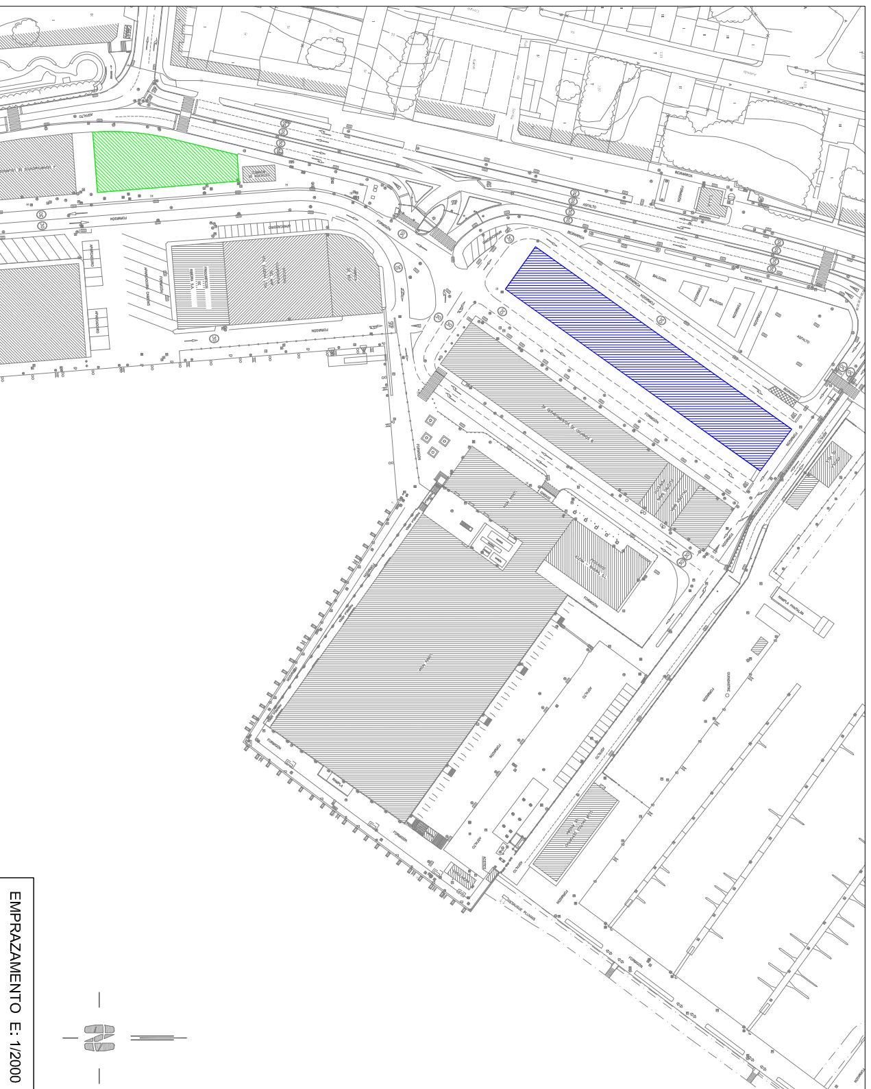
EMPLAZAMIENTO E: 1/2000

SOLICITANTE: ..... Sociedade Cooperativa Gallega del Mar Santa Eugenia, L.TDA.